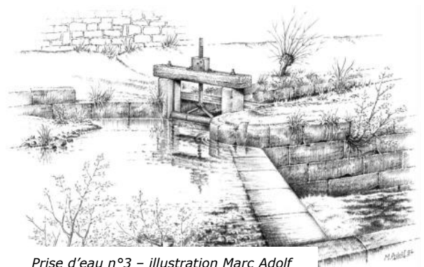
Prise d'eau n°3 – illustration Marc Adolf

Cette opération s'inscrit dans la logique des aménagements déjà réalisés par la CCPR au début des années 2000 et ayant permis l'ouverture au public, en 2007, de Maison de la Manufacture d'Armes Blanches (MMAB) à Klingenthal.