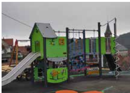
Rénovation aire de jeux : Grendelbruch