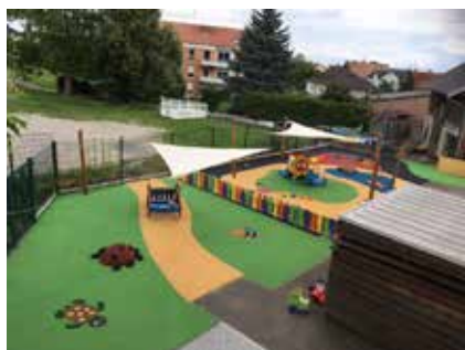
Aménagement du jardin de la MDE