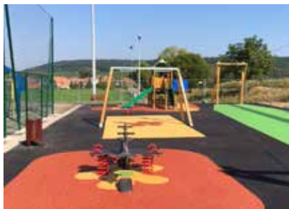
Rénovation aire de jeux : Boersch

En 2016, la Communauté de Communes des Portes de Rosheim aura réalisé quatre chantiers qui profitent directement aux enfants du territoire. Retour en images