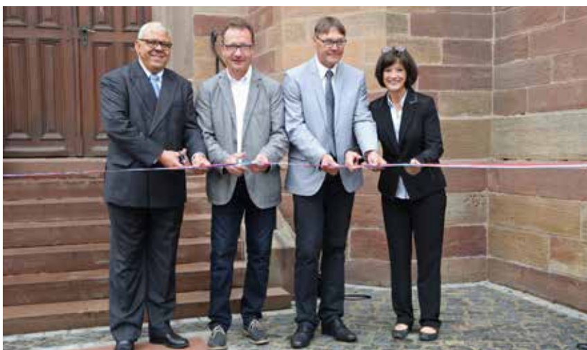
De g. à d. : M. le Sous-préfet, M. le Maire de Griesheim, M. le Président de la CCPR, Mme la Conseillère départementale de l'arrondissement de Molsheim