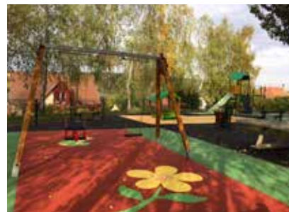
Rénovation aire de jeux : Rosenwiller